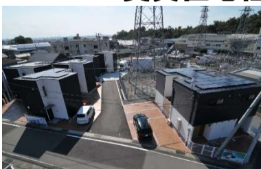
エコヴィレッジ入山瀬

NISHIOGUMIがご提案する戸建賃貸住宅の進化系「エコヴィレッジシリーズ」 賃貸住宅経営のノウハウを凝縮し、20年後を見据えた新しい形の賃貸住宅経営