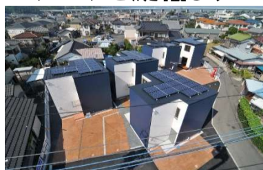
エコヴィレッジ久沢