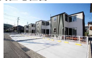
エコヴィレッジ入山瀬II