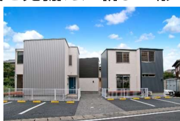
エコヴィレッジ松本