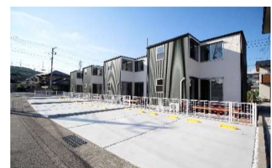
エコヴィレッジ入山瀬II