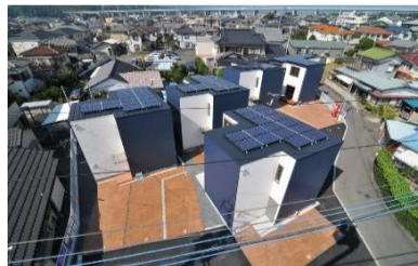
エコヴィレッジ久沢