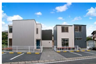
エコヴィレッジ松本