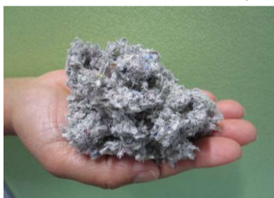
セルロースファイバー断熱材

省エネを実現する「WILL STYLE」の秘密は理想の断熱施工 デコドライ工法(セルロースファイバー素材)による、「無結露20年保証」を実現。