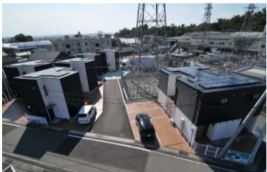
エコヴィレッジ入山瀬

NISHIOGUMIがご提案する戸建賃貸住宅の進化系「エコヴィレッジシリーズ」 賃貸住宅経営のノウハウを凝縮し、20年後を見据えた新しい形の賃貸住宅経営