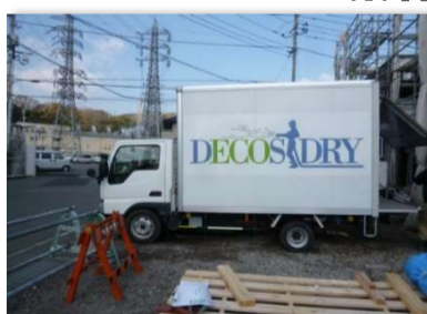
断熱材充填用専用車両